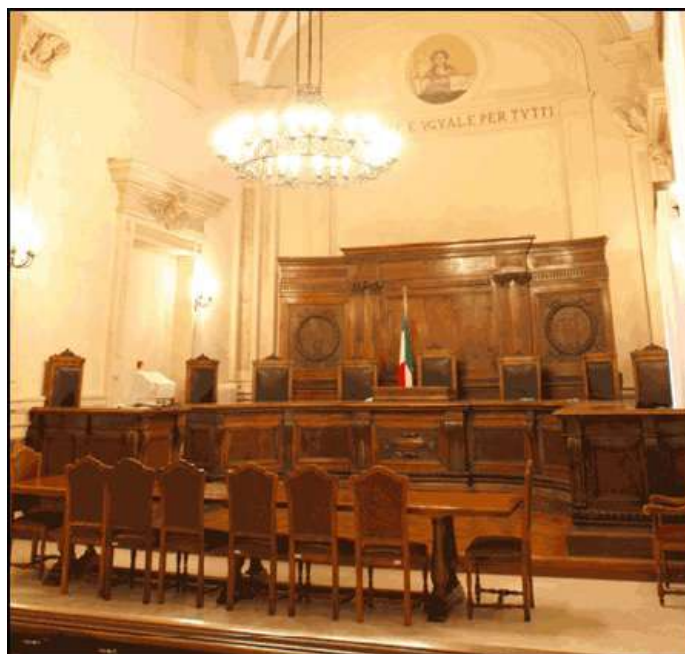
L'aula di udienza del T.A.R. di Lecce

La sfera di competenza del T.A.R. riguarda ricorsi contro atti di organi la cui sfera di azione si esercita in ambito regionale, nonché atti di organi centrali dello Stato e