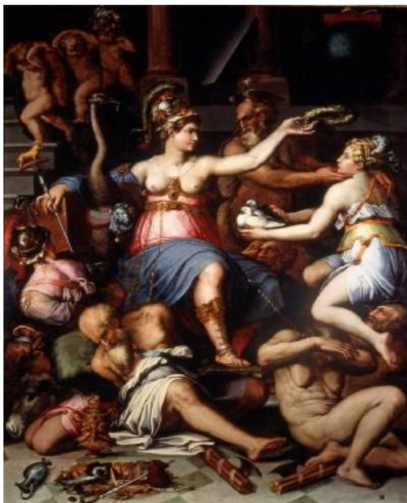
Giorgio Vasari, Allegoria della Giustizia, XVI secolo